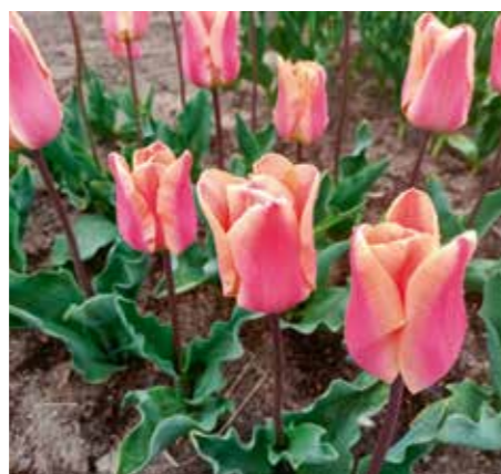
Tulipa 'Apricot Revolution'

Edibulbcode: 600993 Registrant: Schouten Tulips, Zwaagdijk.