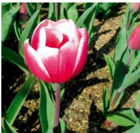
Tulipa 'Grand Slam'

Edibulbcode: 89886 Registrant: Marax Com B.V., Venhuizen. Samenvatting: paars 61B, wit N155B gerand. Winner: Marax Tulips VOF, Venhuizen.