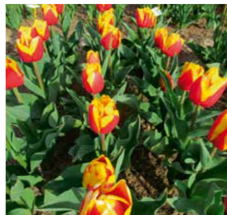
Tulipa 'Nibb it'

Edibulbcode: 600708 Registrant: C.Th. Ammerlaan & Zn. B.V., Breezand