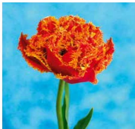
Tulipa 'Hollands Kroon'