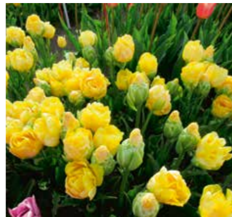
Tulipa 'Andre 75'

Samenvatting: donker paarsrood 187B met bruinpaars N77A. Winner: Remarkable C.V., Lisse.