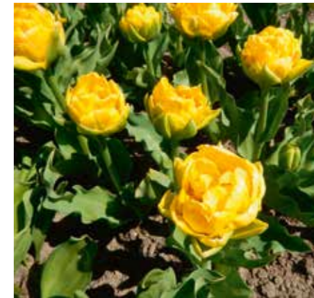
Tulipa 'Yellow Umbrella'