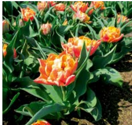
Tulipa 'Summer Sun'

Edibulbcode: 600969 Mutant van: 'Sanne' Registrant: Nic. van Schagen en Zn. B.V., Bergen. Samenvatting: donker roserood 53D, oranjebruin N163B gerand. Winner: Nic. van Schagen en Zn. B.V., Bergen.