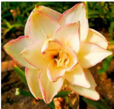
Hippeastrum 'Xiang He'