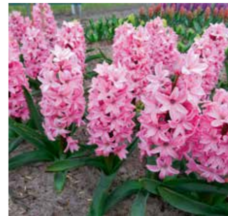
Hyacinthus orientalis 'Rosario'

Edibulbcode: 601080 Mutant van: 'Discovery' Registrant: Maveridge International B.V., Sint Maarten. Samenvatting: wit 155C met violetblauw 91A. Winner: Maveridge International B.V., Sint Maarten.