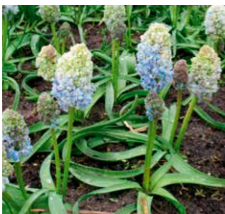
Muscari 'Nature's Beauty'

Edibulbcode: 601052 Registrant: Institute of Botany, Jiangsu Province and Chinese Academy of Sciences, China. Samenvatting: licht blauwviolet 69C met licht blauwrose