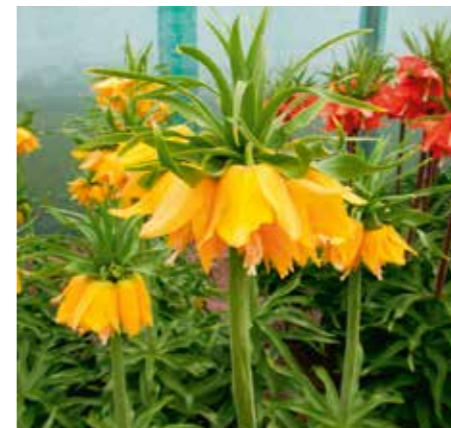
Fritillaria 'Yellow Beauty'