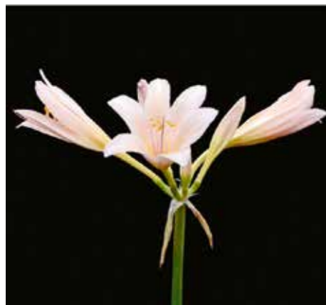
Lycoris longituba 'Yi Xian Tian Xiu'