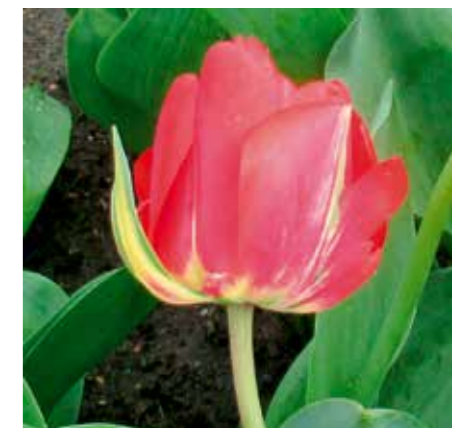
Tulipa 'Red Bono'