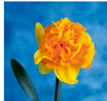
Narcissus 'Hart van Alkmaar'