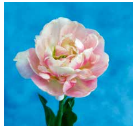
Tulipa 'Libretto Double'

Registrant: Hybris B.V., Lisse. Samenvatting: geeloranje 13C met roodrose 51C. Winner: Hybris B.V., Lisse.