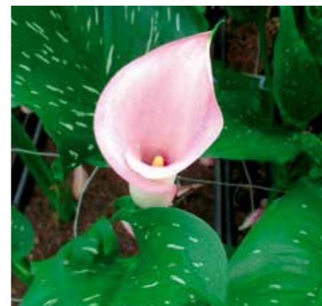
Zantedeschia 'Call Extase'