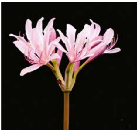
Lycoris sprengeri 'Zhong Shan Fen Lou'

Edibulbcode: 601050 Registrant: Institute of Botany, Jiangsu Province and Chinese