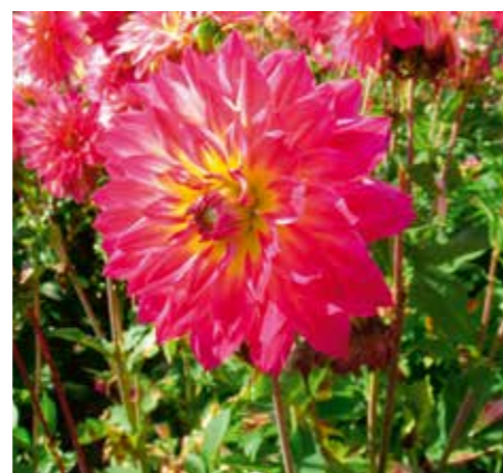
Dahlia 'Rosy Delight'