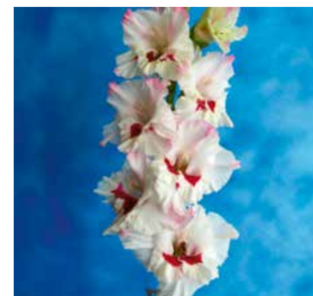
Gladolus 'Cera Corsage'