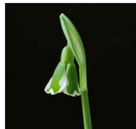
Galanthus 'Dryad Hera'