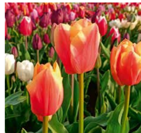
Tulipa 'Peach Beauty'

Edibulbcode: 89653 Registrant: Testcentrum voor Siergewassen B.V., Lisse.