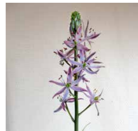
Camassia leichtlinii 'Aurora'