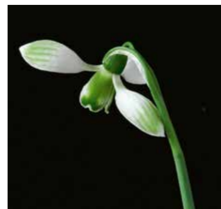
Galanthus 'Dryad Concerto'