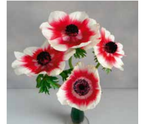
Anemone coronaria 'Duet'