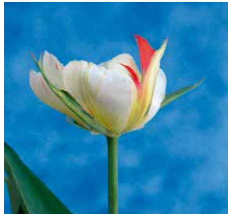
Tulipa 'Stars and Stripes'