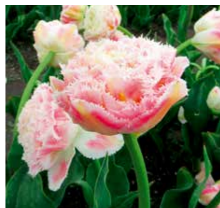
Tulipa 'Patricia Mary'