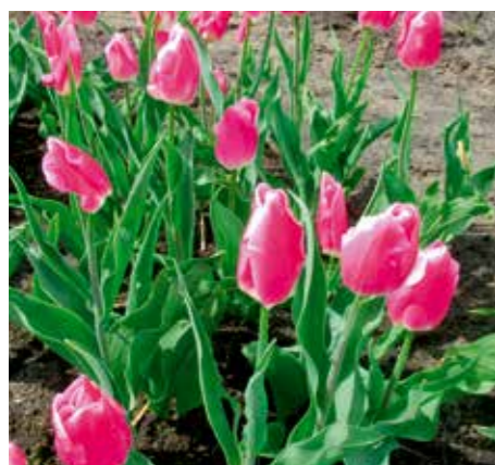
Tulipa 'Novalis Pink'

Edibulbcode: 601020 Registrant: Schouten Tulips, Zwaagdijk. Samenvatting: wit 157D. Winner: Schouten Tulips, Zwaagdijk.