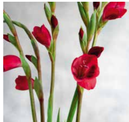
Gladiolus papilio 'Ruby'