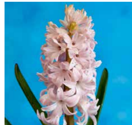
Hyacinthus orientalis 'Maud'