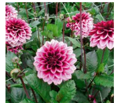
Dahlia 'Davina Michelle'