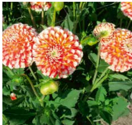
Dahlia 'Jowey Fantasy'

Edibulbcode: 601033 Registrant: Fa. Uitgeest, De Koog.