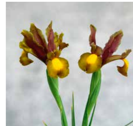
Iris 'Bronze Riviera'

Edibulbcode: 89604 Registrant: Laan Flora Facilities B.V., Zwaagdijk-Oost. Samenvatting: oranje N25C. Spikkels zeer weinig tot weinig, paarsrood.