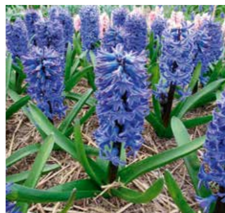
Hyacinthus orientalis 'Blue Future'