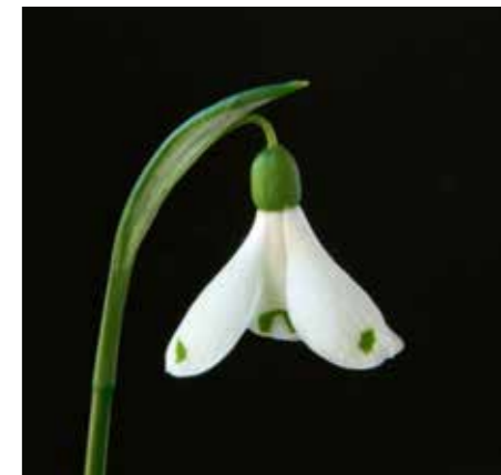
Galanthus 'Dryad Argus'