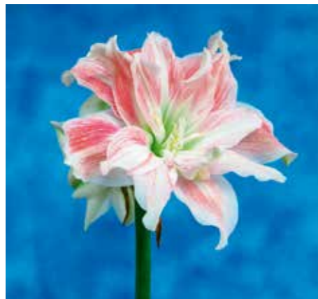
Hippeastrum 'Sweet Amadeus'