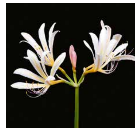
Lycoris caldwellii 'Zhong Shan Huan Xi'