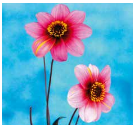
Dahlia 'Neon Flair'