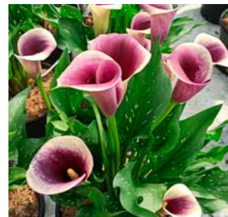
Zantedeschia 'Captain Ranomi'

Edibulbcode: 87293 Registrant: Kapiteyn Breeding B.V., Anna-Paulowna. Samenvatting: donkerviolet 79B, wit 157D gerand. Winner: Kapiteyn Breeding B.V., Anna-Paulowna.