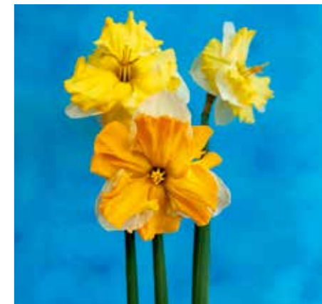
Narcissus 'K's Choice'