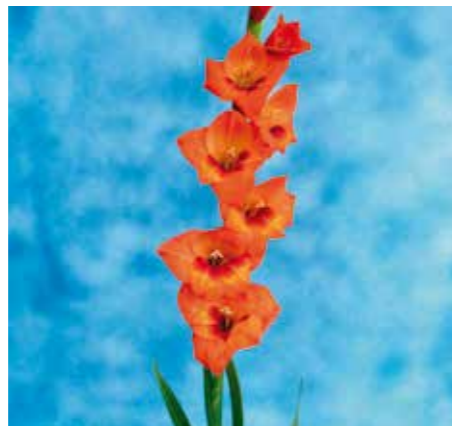
Gladiolus 'Orange Juice'