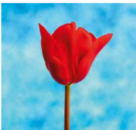
Tulipa 'Paolo Fazioli'