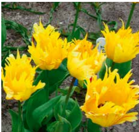
Tulipa 'Golden Leo'