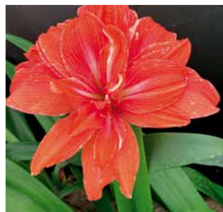
Hippeastrum 'Honey Girl'