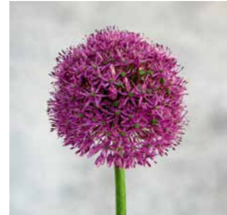
Allium 'Gladiator Sensation'