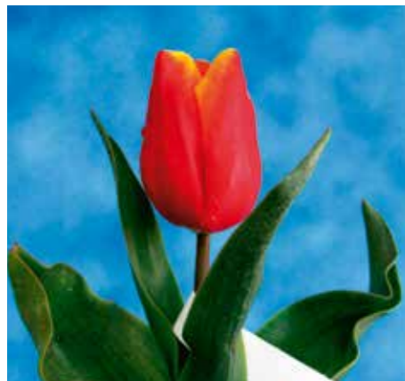
Tulipa 'Fire Game'