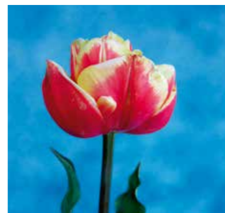
Tulipa 'Expo Beauty'

Edibulbcode: 600835 Registrant: Coöperatieve Vereniging Tuliko, Ens.