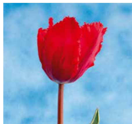
Tulipa 'Arma Design'

Edibulbcode: 89656 Registrant: Testcentrum voor Siergewassen B.V., Lisse.