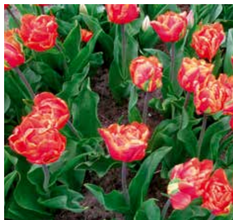
Tulipa 'Monarch Double'