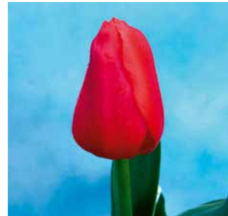
Tulipa 'Verandi Love'