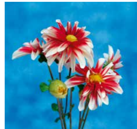
Dahlia 'Windmill Bicolour'

Edibulbcode: 601039 Registrant: Fa. Uitgeest, De Koog.