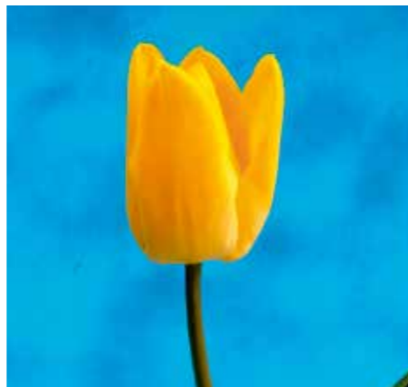
Tulipa 'Golden Tiliro'