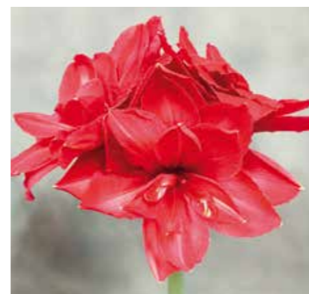
Hippeastrum 'Pink Symphony'