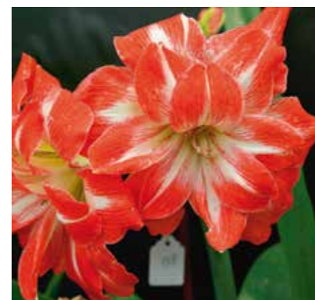
Hippeastrum 'Rouge Snow Sea'