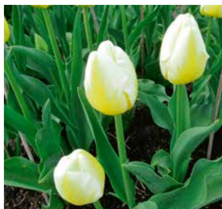
Tulipa 'Angels Flame'

Edibulbcode: 600966 Registrant: KTK Tulpenveredeling, Kloosterburen. Samenvatting: donker paarsrood 60A met donker roserood 53C. Winner: KTK Tulpenveredeling, Kloosterburen.