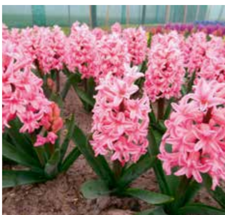
Hyacinthus orientalis 'Amigo'