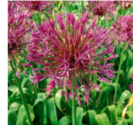
Allium 'Purple Rain'