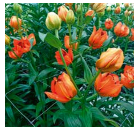
Lilium 'Orange Lampion'