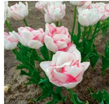
Tulipa 'Wild Romance'