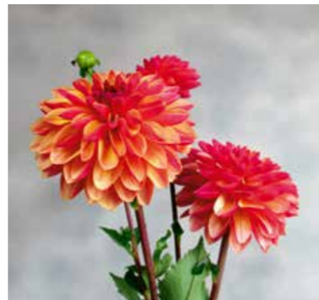
Dahlia 'Madame Antoinette'

Edibulbcode: 601036 Registrant: Fa. Uitgeest, De Koog. Samenvatting: rood 34A met oranjebruin N163B. Winner: Van Ruiten Dahliaveredeling, Sassenheim.