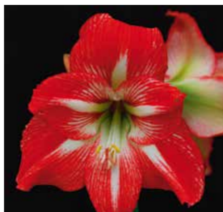
Hippeastrum 'Girl Password'